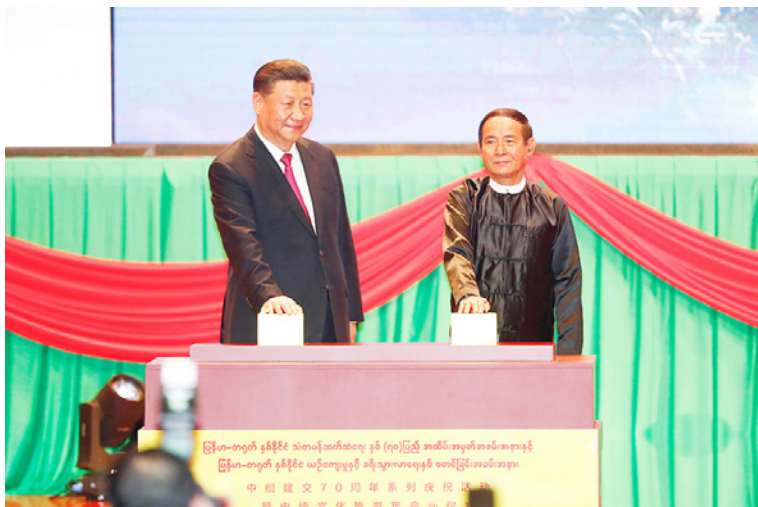
1月17日晚，习近平和缅甸总统温敏共同按下按钮，正式启动中缅文化旅游年

人才、管理等方面都已具备较为雄厚的实力积累和技术底蕴，中国在工业生产、技术创新和先进制造等领域综合实力，已经步入全球产业链、价值链和供应链的中高端层次。缅甸自然资源丰富、先天条件优越，农业和矿产采掘是国民经济的基础产业，但对外贸易仍然是以初级工业制成品和低附加值的原料加工产品为主体出口货物，在全球产业链、价值链和供应链处于较低的层次。中国与缅甸经济发展水平和产业结构存在的客观差距，决定了两国在开展产能错位合作、产业转移对接方面拥有巨大的互补优势和协同效应。